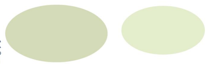
Étiquettes à découper